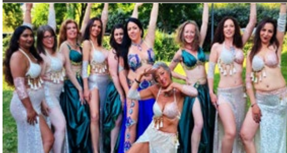
LES PERLES D'ORIENT