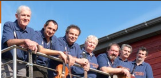
LES GARDONS DE R'DONS

21h30 : Balajo animation - bal populaire