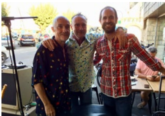
TY BREIZH STAR