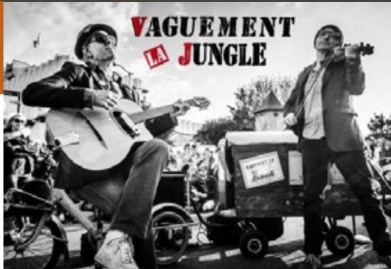
VAGUEMENT LA JUNGLE

Minuit à 1h00 : Ty Breizh Star Années 70 & 80